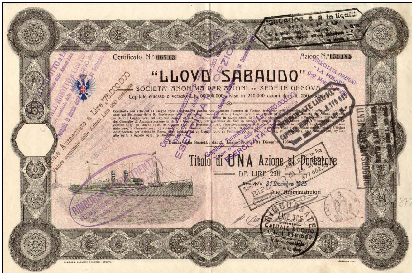
E6757 – Akcie lodní firmy Lloyd Sabaud S.p.A. vydaná 31. 12. 1923 v Janově na 250 lir s řadou razítek dokazující její bohatý akciový život