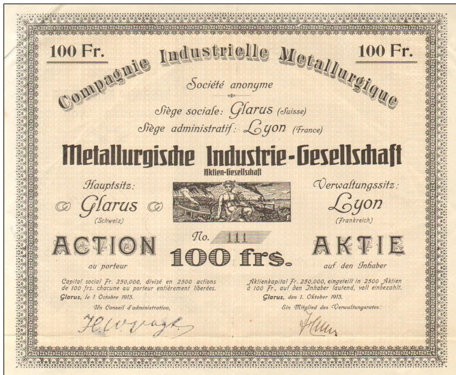
E6759 – Akcie firmy Compagnie Industrielle Metallurgique vydané v Glarusu 1. 10. 1913

Jak bylo již napsáno v úvodu tohoto článku, byly kdysi na Apeninském poloostrově desítky malých státek. Mnohé, byť v územně změněné podobě tu existují dodnes. Jedním z nich je i Vatikán. Jeho celá historie by vydala na knihu, ale zaměříme se na stát, který byl jeho přímým předchůdcem. Oficiální název byl Státo Pontifici čili Papežský stát, přitom je zajímavostí, že na dluhopisu je text i francouzsky, německy a také anglicky. V těchto jazycích jde však o „Římský stát“.