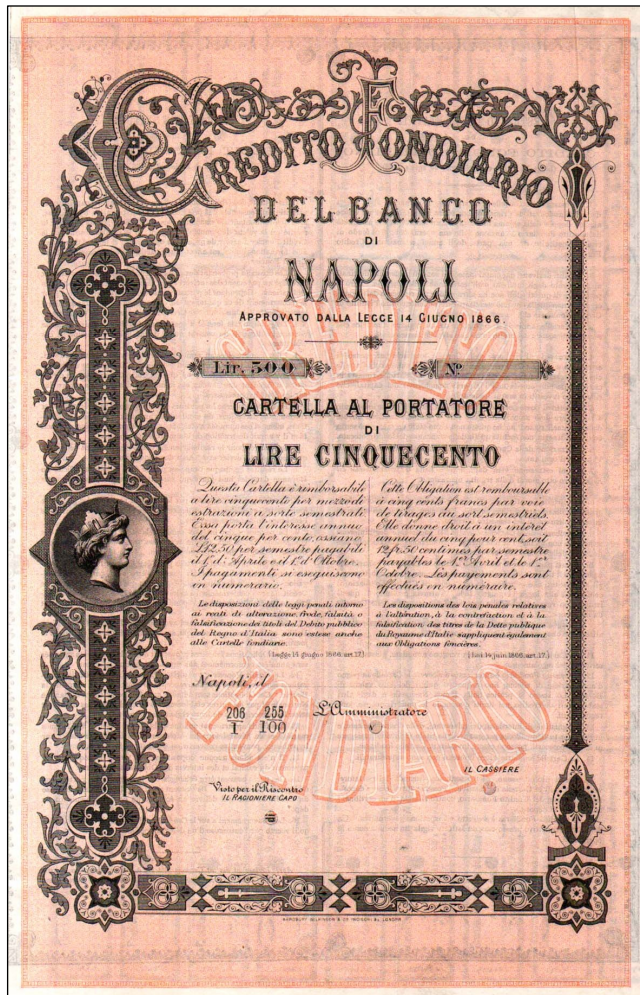
E6756 – Zakladatelský list Neapolské pozemkové banky z r. 1888

I další novinka je z Itálie, tentokrát z Janova. Janovský přístav byl jeden z nejvýznamnějších přístavů ve středozeří. Není divu, že zde měla sídlo lodní společnost Lloyd Sabaud. Byla založena v roce 1905 v Turíně a v roce 1912 přesídlila do Janova. Zajišťovala lodní spojení do severní a jižní Ameriky a do Asie. Nejprve zajišťovala dopravu zboží a osobní dopravu zahájila v roce 1907. V roce 1932 zanikla při sloučení lodních společností Navigazione Generale Italiana a Cosulich Società Triestina. Na jejich základě vznikla Italia Flotte Riunite, kterou však ovládali italská fašisté. Benito Mussolini předsedal sumitu námořnictví, kde ohlásil záměr vlády převzít kontrolu důležitých průmyslových podniků přes státní firmu Società Finanziaria e Industriale Italiana. Podnik později přejmenovaný na Italia di Navigazione SpA (Italia Line) existoval až do roku 2002.