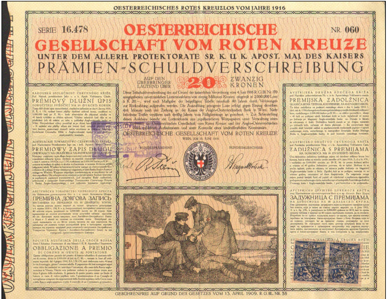
E0371 – Dluhopis Rakouské společnosti červeného kříže, vydaný ve Vídni 15. června 1916 na 20 K, tisk Gesellschaft für Graphische Industrie